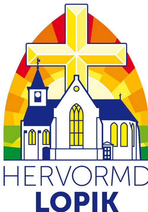
Kerk logo Hervormde gemeente van Lopik 2023

Als je goed kijkt zijn de verticale bindroede 2 van de ramen in het