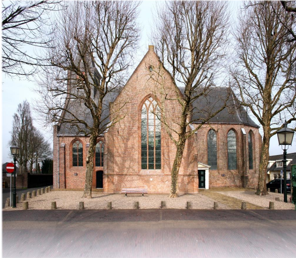
Hervormde kerk van Lopik aan de dorpsstraat.

middenschip en de zijbeuk wel getekend in het logo en van het koor niet. Dat komt omdat de verticaal lopende roeden in de gotische ramen in het middenschip en zijbeuk van baksteen is gemaakt. De verticale roede in het koor zijn van ijzer. Dit geeft een dunnere lijn weer. Je kunt dit duidelijk zien op de foto hieronder.