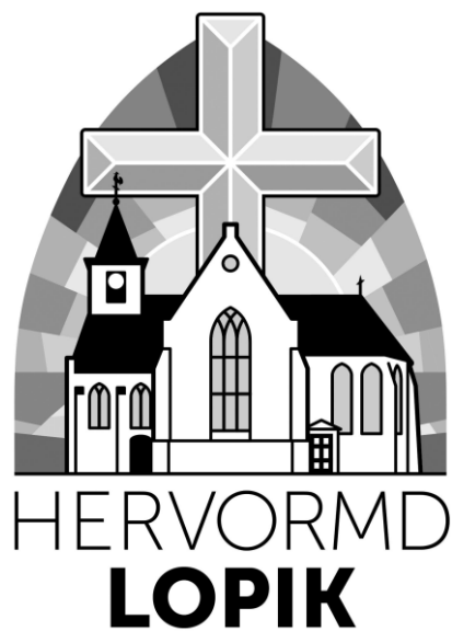
Kerklogo uit 2023