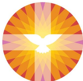
PKN logo van 2023