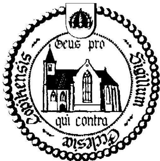
Kerklogo uit 1988

Het kerklogo is in 2017 ook gedigitaliseerd door Cor Verweij.