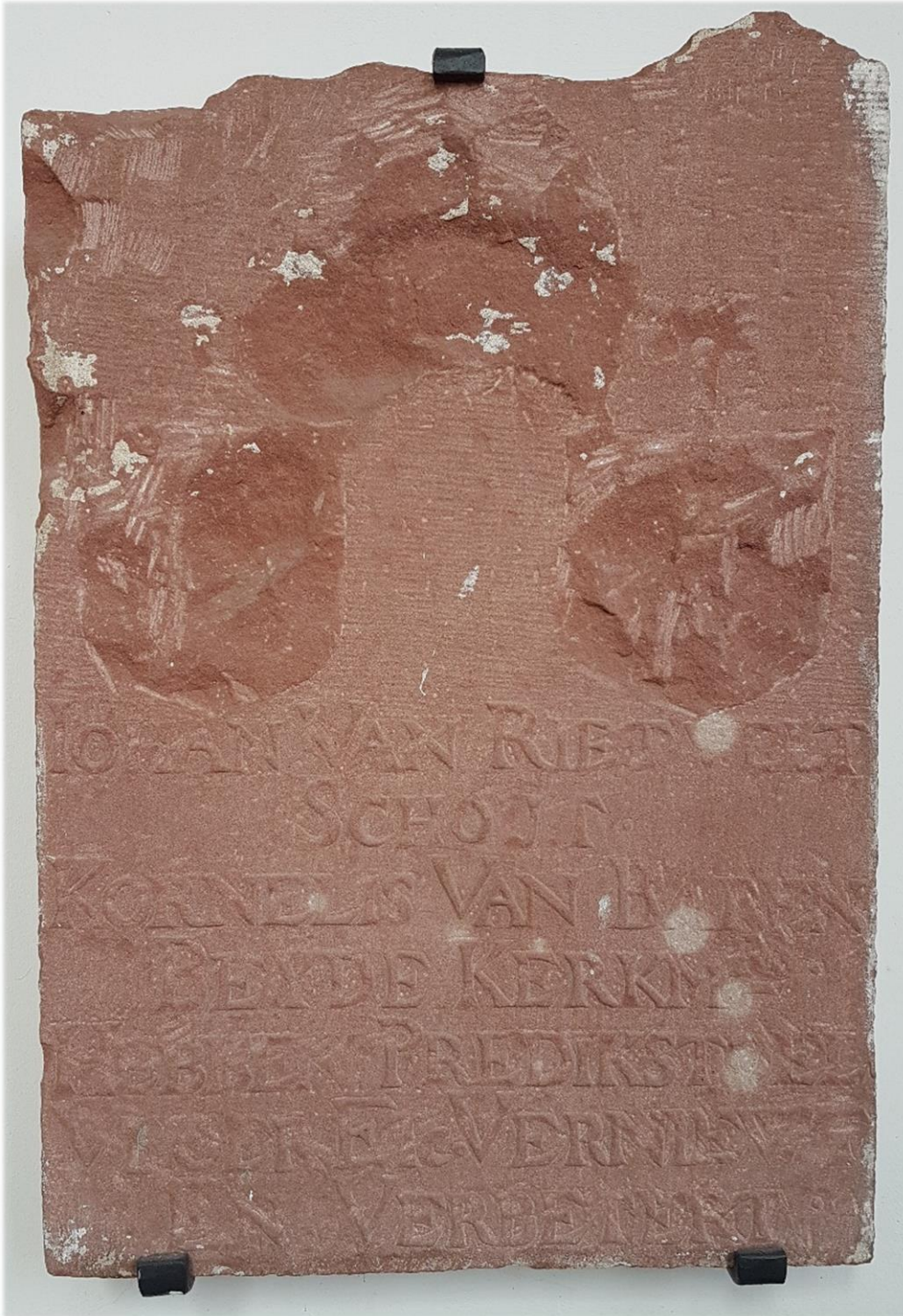
Afb.5. Gedenksteen ter herinnering van het vervangen van grafzerken in de kerk. In de Franse tijd is deze steen zwaar beschadigd.