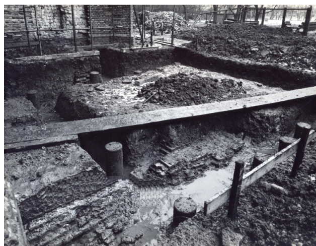
Afbeelding 5. Afbraak toren en fundering voor de nieuwe huidige toren. Foto uit 1965.