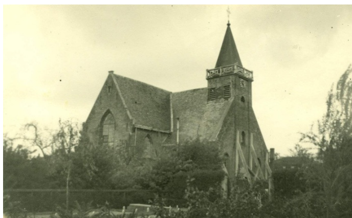
Afbeelding 4. Kerk met steunberen en de houten balustrade, genomen vanaf de begraafplaats.

De tweede klok, de Johannes Evangelista, heeft 3 jaar niet in de toren gehangen, maar in een opslag gestaan, waar is niet bekend. Na de restauratie in 1967 is de vierde (huidige) toren af en hangt de Johannes Evangelista klok weer in de toren 8 .