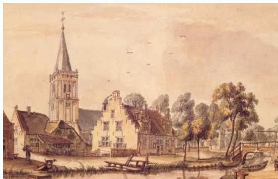
Afbeelding 1. Ingekleurde pentekening kerk van 1745 gezien vanaf de Wielsekade.

Uit de archieven lezen we dat in 1436 de Utrechtse bisschop (Rudolf van Diepholt) een verordening uitgeeft, dat de klok "moet" slaan in geval van nood (het waren de naweën van de Hoekse en Kabeljauwse twisten in het graafschap Holland, die later overwaaiden naar het bisschoppelijke Sticht Utrecht).