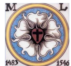
Afbeelding 2. Het rozenkruis van de kerkhervormer Maarten Luther.

"Het eerste zal een kruis zijn, zwart in een hart, dat zijn natuurlijke kleur heeft. Omdat men zo van het hart gelooft, dat het gerechtvaardigd wordt. Zo'n hart zal midden in een witte roos staan, teken, dat het geloof vreugde, troost en vrede geeft. Daarom zal de roos wit en niet rood zijn; de witte kleur is van de Geest en van alle engelen de kleur.