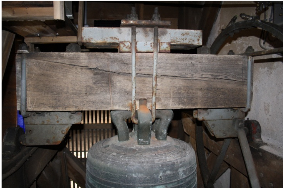
Afbeelding 5. Ophanging van de klok aan eikenhouten rechte luidas. Rechts zie je het klokkenwiel verbonden aan de rechte luidas.