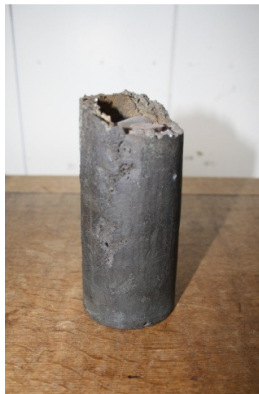
Afbeelding 3. De afgebroken klepelstaart, in consistorie.

De klepel speelt een belangrijk rol voor de klankkwaliteit van de klok. De klepelschacht en klepelbol zijn intact, alleen de vlucht of staart van de klepel (het gedeelte dat zich onder de klepelbol bevindt) is beschadigd. Hij is onder de klepelbol afgebroken. Wanneer dat gebeurd is, is niet bekend. Het stuk klepelstaart ligt nu in de consistorie.