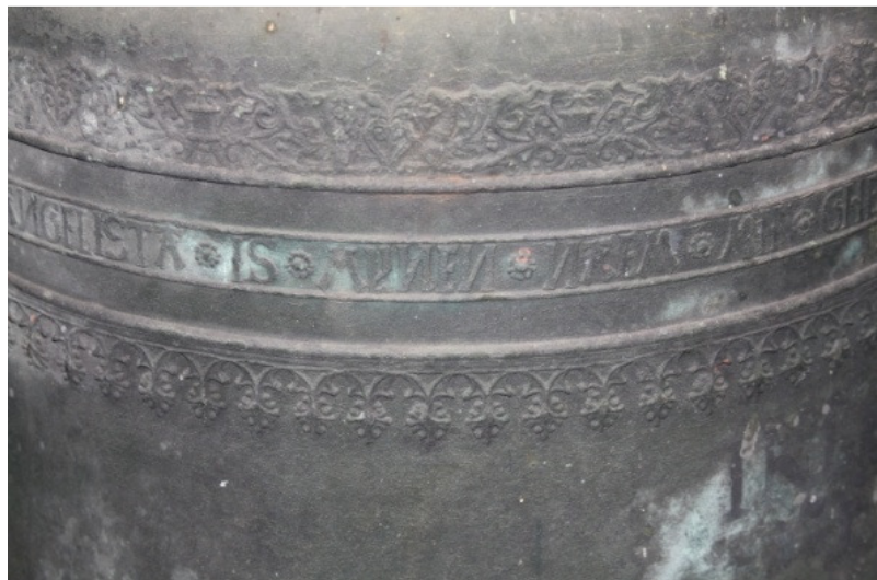
Afbeelding 1. De letters N en IJ in spiegelbeeld.

Als je goed kijkt naar de tekstrand van de klok zie je een aantal opvallende dingen. De letter N en IJ staan in spiegelbeeld. Ook de letter M, is de omgekeerde W. Waarschijnlijk had Jan Moor een aantal Russische mensen in dienst die de Nederlandse taal niet helemaal machtig waren. De letter N komt uit het cyrillisch alfabet, de Russische taal maakt hier gebruik van. De omgedraaide letter IJ weten we niet waar dat vandaan komt. Wat verder opvalt, zijn de symbolen die tussen de woorden staan.