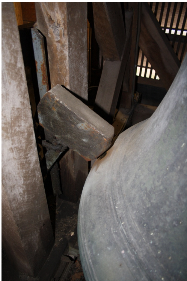
Afbeelding 6. IJzeren hamer voor het slaan van de halve en het hele uur.

De klok weegt 1185 pond, dat is 592,5 kilo. De afmetingen van de klok zijn; 96 cm hoog, 56 cm breed in het midden, 96 cm breed bij de onderste rand.