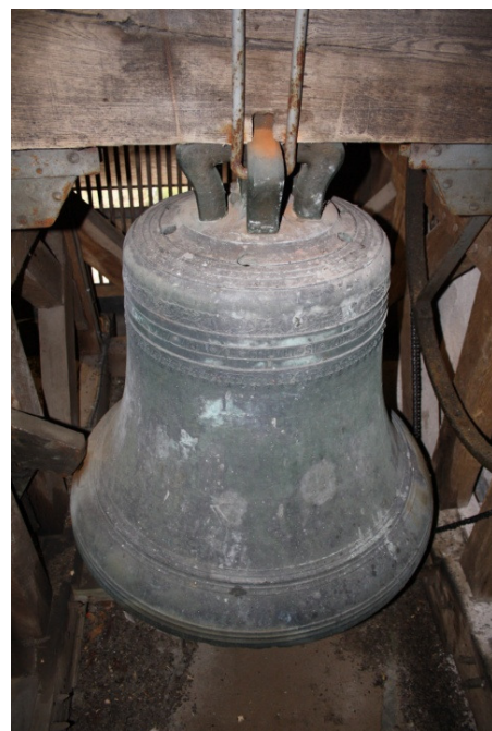
Afbeelding 4. Johannes Evangelista.