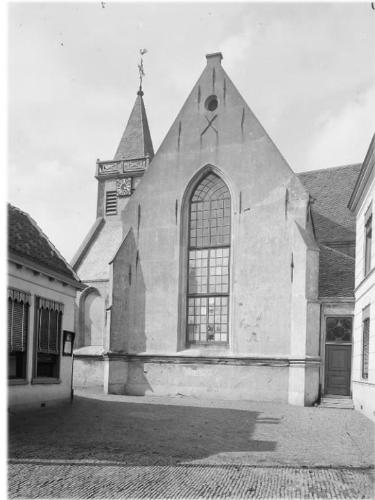
Afb. 3. Foto kerk vanaf de zuidkant genomen, met rechts naast de pastorie de toegangsdeur van de consistoriekamer.