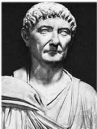
Afb 1. Gaius Aurelius Valerius Diocletianus (± 236-316 na Chr.) is van 284 tot 305 na Christus keizer van het Romeinse Rijk.

Na de Reformatie werd met consistorie, binnen de Protestantse kerk, de kerkenraad bedoelt. Dat is het bestuur van een plaatselijke kerkelijke gemeente, met predikant, ouderlingen en diakenen. Met consistorie word ook wel een ruimte bedoelt, zoals hierboven beschreven. Dit wordt ook wel aangeduid als consistoriekamer. Dat is de ruimte waar de kerkenraad vergaderd en ook waar het consistoriegebed wordt gehouden voordat de kerkdienst begint en het dankgebed na de kerkdienst. De consistoriekamer bevindt zich normaal gesproken binnen het kerkgebouw of er vlak naast.